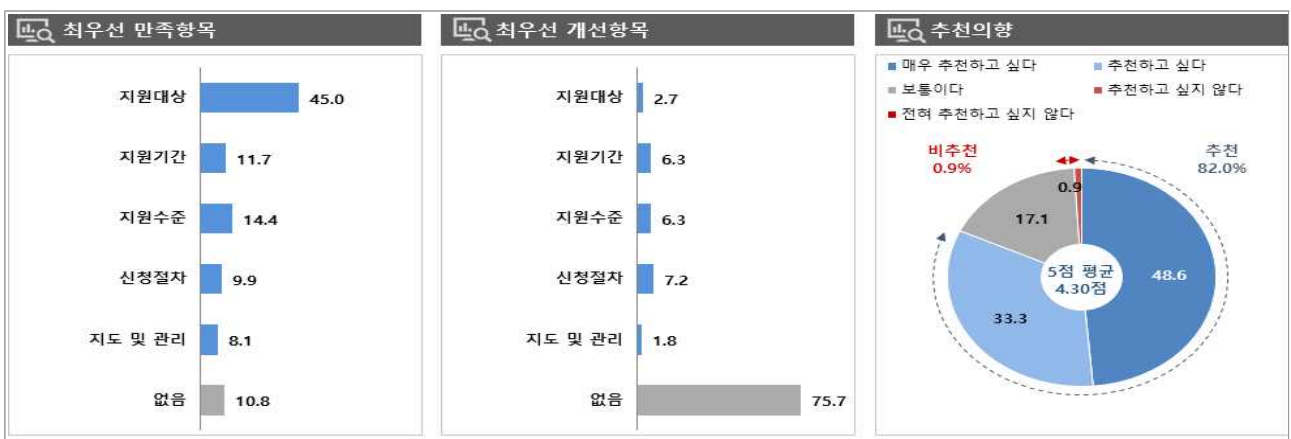
[그림 1] 고용보험 미적용자 출산급여 만족/개선 항목 및 추천 의향

주: 1) 만족항목 - 전체: 지원대상(28.8) > 지도수준(16.9) > 지도/관리(10.3) > 지원기간(9.8) > 신청절차(9.1) ; 없음(25.1) - 모성보호: 지원대상(45.0) > 지원수준(14.4) > 지원기간(11.7) > 신청절차(9.9) > 지도/관리(8.1) ; 없음(10.8) 2) 개선항목 - 전체: 신청절차(8.6) > 지원기간(5.9) > 지원수준(4.8) > 지원대상(3.7) > 지도/관리(3.1) ; 없음(74.0) - 모성보호: 신청절차(7.2) > 지원기간(6.3) > 지원수준(6.3) > 지원대상(2.7) > 지도/관리(1.8) ; 없음(75.7) 3) 추천 의향 - 전체: 4.29점, 추천(81.9=31.4+50.5) > 보통(15.4) > 비추천(2.7=2.1+0.6) - 모성보호: 4.30점, 추천(82.0=33.3+48.6) > 보통(17.1) > 비추천(0.9=0.9+0.0)